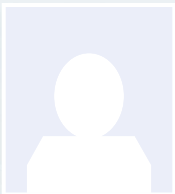
Marie-Paule Poilpot - Membre du CA depuis 2017 Représentant les usagers (Titulaire) - UNAFAM