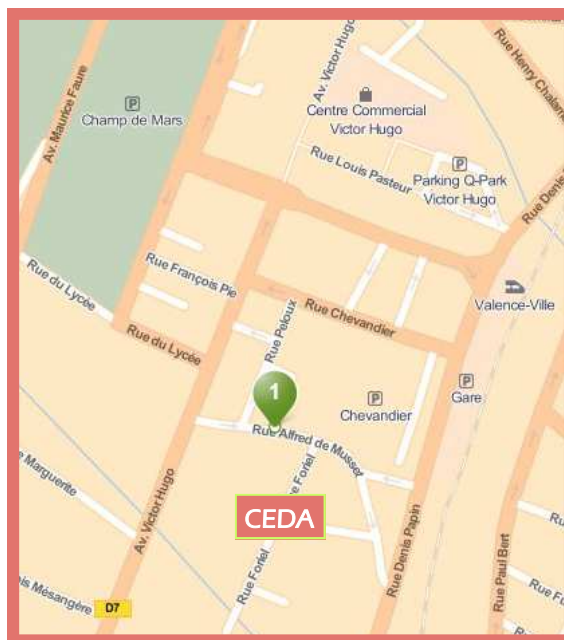
Parking Chevandier à proximité